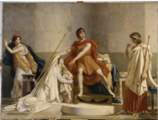
Andromaque et Pyrrhus

Vous trouverez quelques tableaux ci-dessous, en lien avec la pièce.