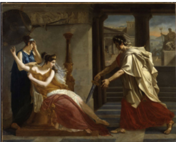
Oreste annonçant à Hermione la mort de Pyrrhus

Jacques-Louis David, 1783, 2,75 m x 2,03 m, Musée du Louvre