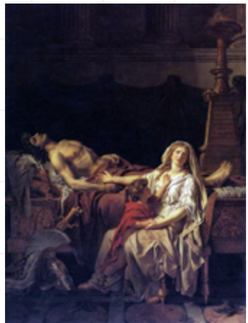
La douleur et les regrets d'Andromaque sur le corps d'Hector

Pierre-Narcisse Guérin, H.130 ; L.174, Collections des musées de France (Joconde)